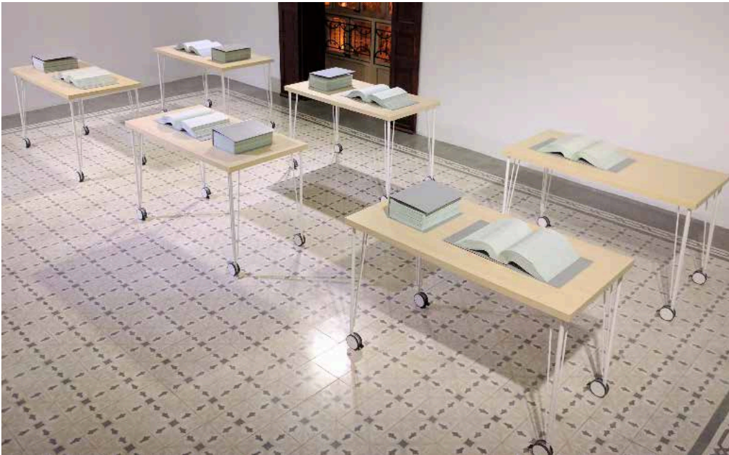
Each and Every Command , vue d'exposition, Galerie Horrach-Moyà, Palma, 2017.