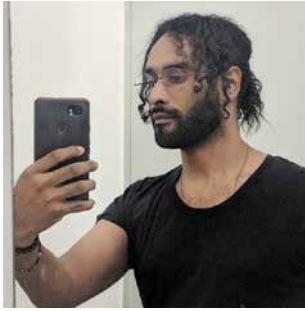
Will Fredo @willfredo247

Romancière. Critique de mode et instagrameuse pour L'Obs (@L_observatrice) Paris