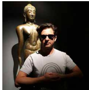
Franck Ancel @ancelfranck

Psychanalyse, scénographie, édition. Paris