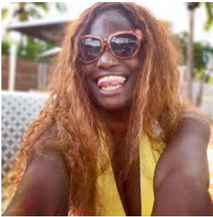
Flore Baudry @baudryflore

Pink Flamingo Lifestyle. From Reunion Island. Lovelife photographer. Happiness creator. Rugby Lover. Proud Mum of 1 + 1 + 2 www.florephotography.fr