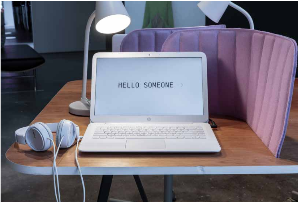
Lauren, installation en réseau, détail, 2018