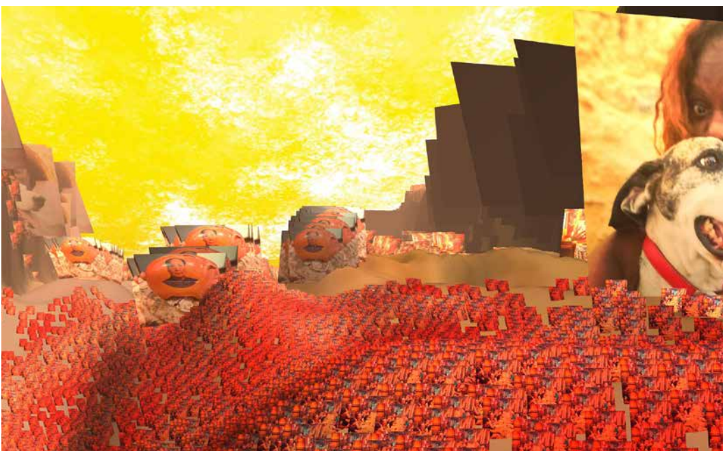
Stalker , projet pour Selphish , image de travail de l'environnement de jeu, 2019