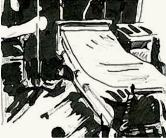
Chambre 4, Hôpital Européen