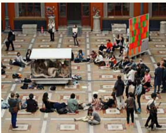
"Circo Mínimo" - "Le kiosque électronique" - "La tribune" Paris - 2016