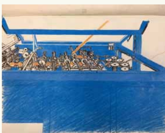
Curioni, Milhe & Avons Marseille - 2018