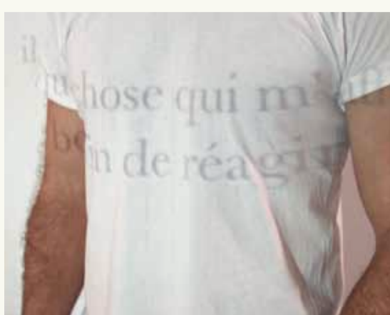
Il y a quelque chose qui m'affecte et j'ai besoin de réagir 2012