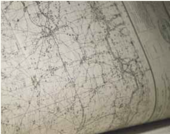
SEA-ME-WE 2 2017