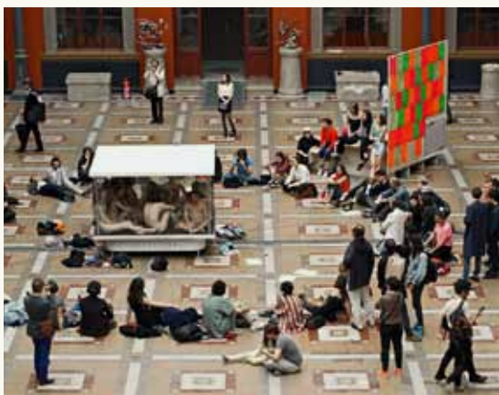
"Circo Mínimo" - "Le kiosque électronique" - "La tribune" Paris - 2016